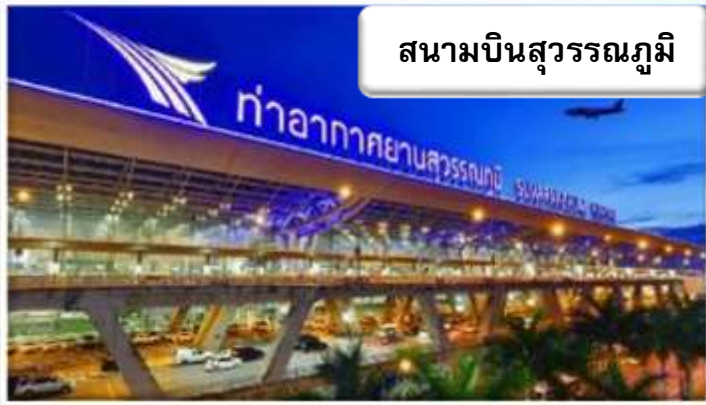
สนามบินสุวรรณภูมิ

เวลา 22.30 น. พร้อมกันที่ ท่าอากาศยานสุวรรณภูมิ อาคารผู้โดยสารขาออกระหว่างประเทศ เคาน์เตอร์ สายการบินไทยแอร์เอเชียเอ็กซ์ เจ้าหน้าที่คอยให้การต้อนรับ ดูแลด้านเอกสาร เช็คอิน และสัมภาระในการเดินทาง