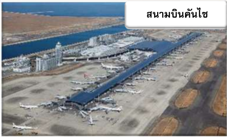
สนามบินคันไซ

เวลา 01.00 น. ออกเดินทางสู่ สนามบินคันไซ ประเทศญี่ปุ่น โดยสายการบินไทยแอร์เอเชียเอ็กซ์ เที่ยวบินที่ XJ 612