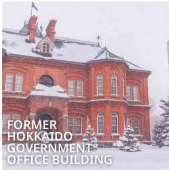
FORMER HOKKAIDO GOVERNMENT OFFICE BUILDING