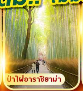
ป่าไฟอาราชิยาม่า