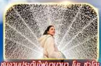
ชมงานประดับไฟนาบามา โนะ ซาโตะ