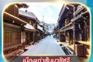
เมืองเก่าชินมาชิซูจิ