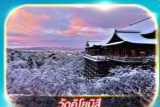
วัดคิโยมิตสึ