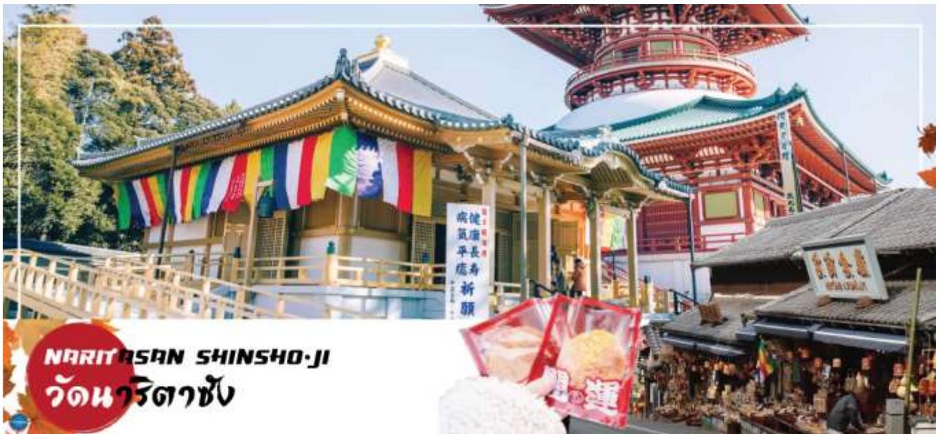
NARITASAN SHINSHO-JI วัดนาริตาซัง

เมืองนาริตะ – วัดนาริตะชิน – ถนนปลาไหล โอโมเตะซังโตะ – กรุงโตเกียว – ตลาดปลาซึกิจิ – ชมแมวยักษ์3มิติ พร้อมช้อปปิ้งย่านชินจูกุ – เมืองนาริตะ