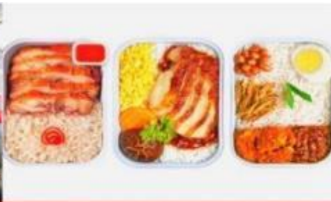
บริการอาหารร้อน ทั้งขาไป-ขากลับ