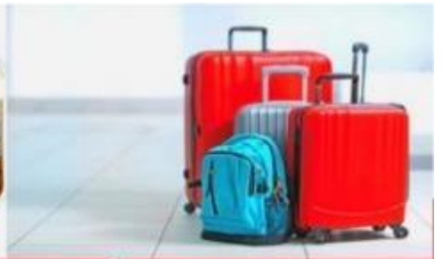
น้ำหนักกระเป๋า สูงสุด 20 กก.