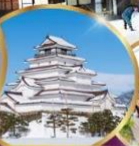
ปราสาท สึรุกะ