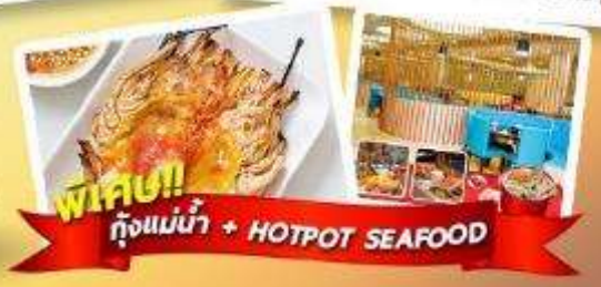
พิเศษ!! ก๊งแม่น้ำ + HOTPOT SEAFOOD