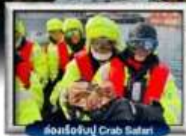
ส่องเรือจับ Crab Safari