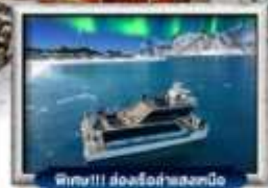
พิชิต!!! ส่องเรือสำแสงเหนือ

บินทรู สายการบิน Full Service | พิเศษ! ว่าง King Crab