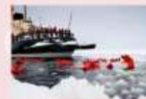
ล่องเรือตัดน้ำแข็ง Ice Breaker