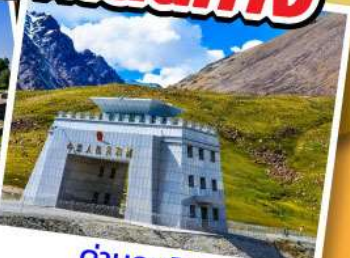
ด่านคุนจิราบ