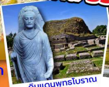
ดินแดนพุทธโบราณ ตักศิลา