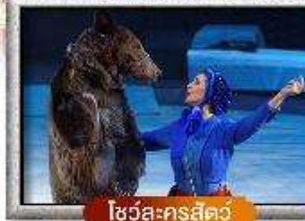
โซวล์-ครสค์