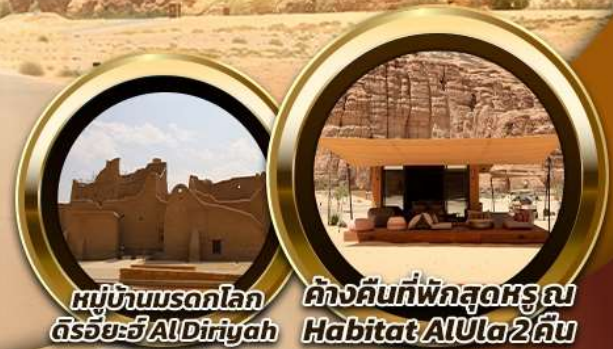
หมู่บ้านมรดกโลก ตรีชัยะวี AlDiriyah

บินหรู อยู่สบาย เที่ยวซิลด์ ซิลด์ 10 ท่าน คอนเฟิร์มเดินทาง