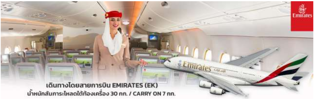
เดินทางโดยสายการบิน EMIRATES (EK) น้ำหนักสัมภาระ:โหลดใต้ท้องเครื่อง 30 กก. / CARRY ON 7 กก.