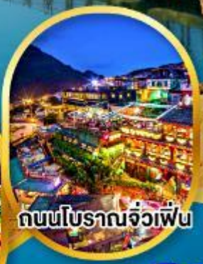
ถนนโบราณจิวเฟิ่น