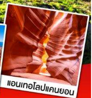
แอนเทอโลปแคนยอน