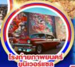
โรงถ่ายภาพยนตร์ ยูนิเวอร์แซล