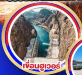
เฟือนฮูเวอร์

ช้อปปีงจิวเอี๊ยท์ลีตออนตารีโอมิลล์ ช้อปปีงบาร์ทสไควเอี๊ยท์ลีต