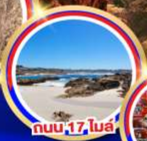
ถนน 17 ไมล์