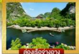
สองเรือจ้างอ่าง