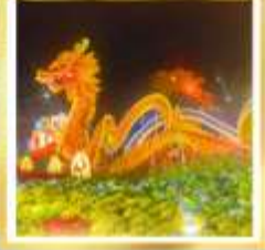
นั่งเรือกระดัง