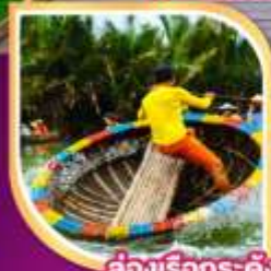
ล่องเรือกระด้ง