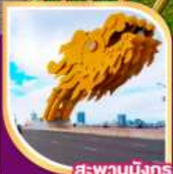
สะพานมังกร

28 พ.ย.- 01 ธ.ค. 67 07-10 ธ.ค.67 ( วันรัฐธรรมนูญ ) 23-26 ม.ค.68, 06-09 ก.พ.68 13-16 มี.ค.68