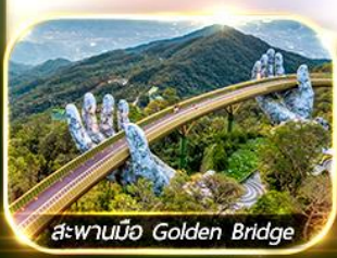
สะพานมือ Golden Bridge