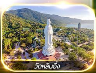
วัดหลินอึ้ง