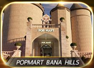
POPMART BANA HILLS

สัมพัสดความงามหมู่บ้านฝรั่งเศสที่บานาฮิลล์ ซอปปิง POPMART