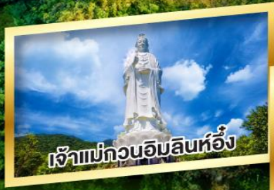
เจ้าแม่กวนอิมสินห่อ้ง