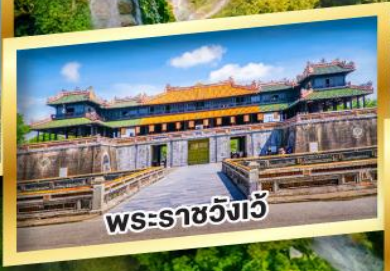
พระราชวังเว็