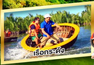
เรือกระดิง

พัก บานาฮิลล์ 1 คืน, ดานัง 1 คืน, เว็ 1 คืน